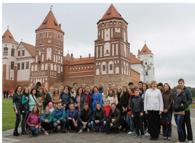
Экскурсия в Мирский замок в 2014 году

При кафедре функционирует Исследовательский центр имени Саймона Кузнецца (SKRC), который выпускает линейку аналитических продуктов, в том числе Аналитический обзор состояния экономики Беларуси. Партнерами SKRC выступают Министерство экономики, Национальный банк, CASE Belarus.