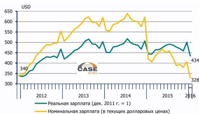
Рис. 2. Среднемесячная зарплата в долларовом выражении (по сравнению с декабрем 2011 года)

Например, в долларовых ценах декабря 2011 года реальная зарплата в январе 2016 года составила 434 долларов (рис. 2).