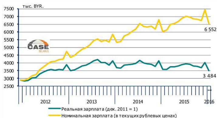
Рис. 3. Заработная плата в рублевом выражении, тыс. BYR

К слову, такое сокращение происходит уже пятый месяц к ряду (с августа прошлого года). При этом декабрь в расчет брать не стоит, поскольку в этом месяце предновогодние выплаты приводят к сезонному всплеску уровня зарплате. В январе же 2016 года продолжился нисходящий тренд по снижению уровня номинальной средней зарплате. За последние полгода средняя номинальная зарплата снизилась на 457 тыс. BYR – с 7 млн. 008 тыс. BYR в июле до 6 млн. 552 тыс. BYR в январе (рис. 3).