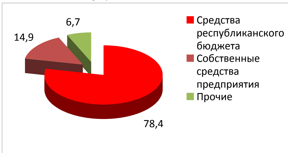
Рисунок 2-Структура инвестиций РУП «Белмедпрепараты» за 2009 г. Примечание – Источник:[2, с.140].

В качестве подтверждения вышесказанного привожу структуру инвестиций за 2009 год (рисунок 2).