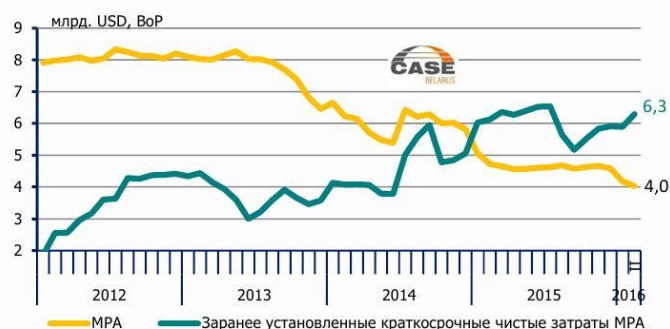
Рис. 2. Заранее установленные затраты МРА в течение года