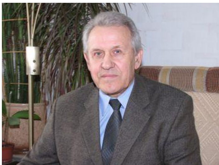
Фото: Леонид Злотников. ЭКОНОМИКА.ВУ

Заинтересовала эта тема и экономиста Леонида Злотникова, который прочитал данный раздел и представил к публикации свое мнение о его содержимом.